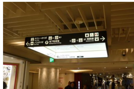
【リニューアル後】 館内 方向案内サイン