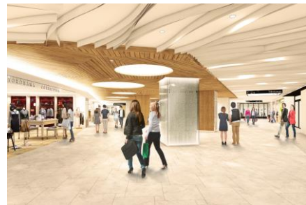
【リニューアル後】 新生「相鉄ジョイナス」B1(三角広場)