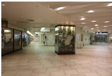
【現状】 相鉄ジョイナス B1(三角広場)