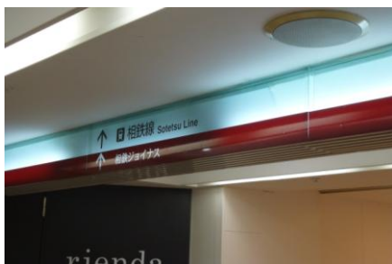
【現状】 館内 方向案内サイン