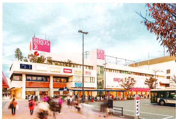
「港南台バーズ」の外観