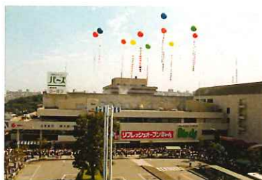
1983年に第二期オープンをした港南台バース

内容：「港南台バース」が高島屋港南台店とともに歩んだ36年間を振り返る写真を展示。社会の動きや出来事とともに紹介します。また、8月1日（土）～8月31日（月）の期間中は、抽選でバースお買物券が当たるクイズラリーも同時開催。（参加無料）