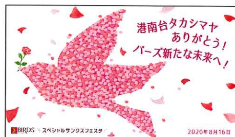
メッセージボード（イメージ）

内容：会場で配布するメッセージカードにお客さまがメッセージを記入し、メッセージボードに貼付。お客さまと一緒にメッセージボードを作り上げます。（参加無料）