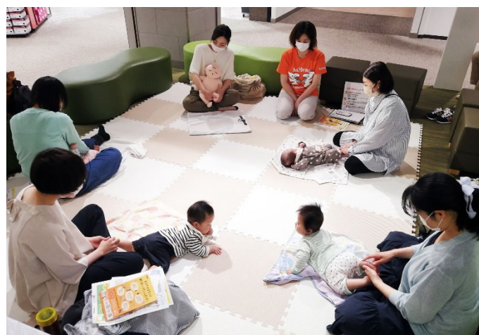
子育てイベントの様子